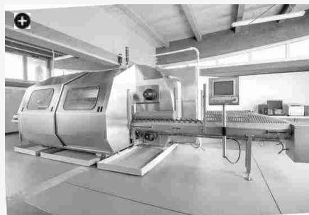
L'impianto di pastorizzazione a freddo di Villa Food