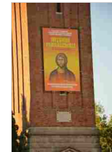
Apertura della Missione nelle 7 parrocchie di Basiliano 7 set | 12:09