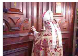
L'apertura della Porta Santa in Cattedrale 14 dic | 13:17