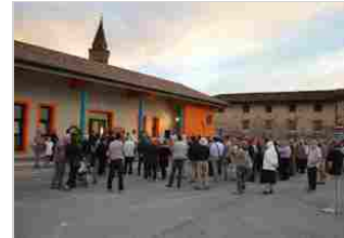
Paese in festa a Lumignacco per il nuovo centro di aggregazione parrocchiale 21 set | 11:22