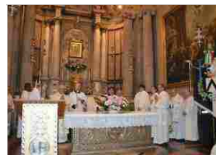
Voto Cittadino 25 ott | 19:21