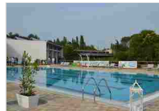
Riapre l'ex Sporting Primavera. Le foto dell'inaugurazione 7 lug | 10:15