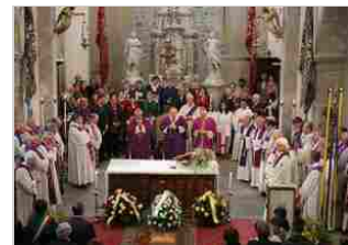
L'ultimo saluto della Carnia a mons. Renzo Dentesano 14 set | 19:44