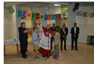
Nuovo oratorio di San Paolino - Udine 6 set | 09:27